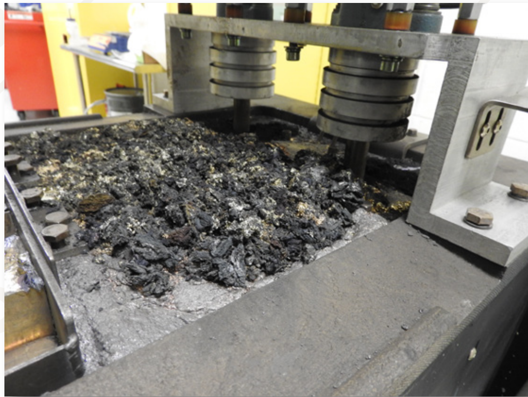
带一英寸浮渣的焊锡炉